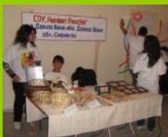
СОУ "Неофит Рилски" гр. Долна баня, обл. София

Медийното отразяване е един от най-стимулиращите фактори за участието на учениците