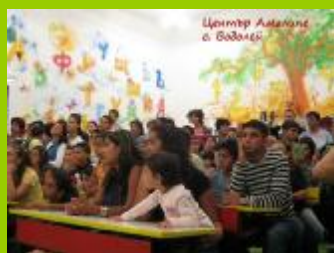
Ограмотителния център в ОУ «Хр.Смирненски» С.Водолей

Подобна атмосфера е създадена и в ОУ "Христо Смирненски" – с. Водолей, общ. Велико Търново. В една от класните стаи е създаден "ограмотителен център". За целта по стените на стаята са нарисувани с богата гама от цветове буквите и цифрите на числата до 10 . Осигурен е богат нагледен материал, който да подпомага процеса на ограмотяване. Целта е да се създаде подходяща привлекателна среда, която да стимулира децата към учене. Нещо повече, за работата в час се използват модулни маси, които често се разместват. Подреждат се в кръг, а в центъра на кръга е постелена черга, която самите деца са донесли. Често и децата седят не зад чиновете, а в кръг в средата на стая. Преподавателят също е част от кръга. Дъската, стените и шкафовете също са украсени с неща, които децата са донесли. По този начин те пресъздават част от атмосферата у дома и създават място, където да се чувстват уютно.