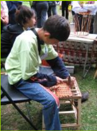
ОУ "Г.С.Раковски", с. Болярци, обл. Пловдив

Тук няма да бъдат разглеждани всички проблеми, водещи до липсата на мотивация и отпадането на децата от училище, а само онези, които могат да бъдат разрешени със социално-педагогическа работа.