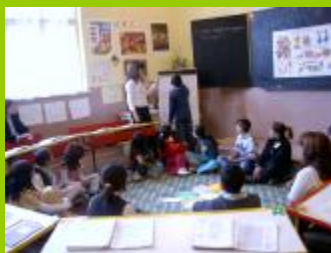
ОУ "Хр.Смирненски" С. Водолей, обл. В.Търново

"Христо Смирненски" – гр. Кочериново, където училищната среда е превърната в пълния смисъл в "желана територия на ученика". Учебната среда е изключително раздвижена. Класните стаи са изрисувани от самите ученици по нетрадиционен начин, която създава наистина благоприятна среда. Всеки випуск получава определено място (в някоя класна стая, коридор и т.н.) където оставя нещо от себе си. По този начин се запазва връзката на учениците с училището. Във фойето на училището например, випуск 2005 са нарисували стена от тухлички, в която всеки е изписал името си. Дори радиаторите в коридорите са боядисани в зелено и бяло. Класните стаи са добър пример за интерактивност и за това как дори и кабинета по математика и химия може да бъде направен по разнообразен начин. В единия коридор е подреден етнографски кът "Бащино огнище". Един от клубовете се нарича "Опознай природата". В работата на клуба се прилага силно индивидуален подход. На таблото на клуба всяко дете е написало името си във формата на сърце, кръг или др. Отношенията учител – ученик са свободни. Явно е, че децата са стимулирани да заемат собствена позиция и в същото време запазват уважение към учителя. Това личи дори и при малките ученици. Показателни за цялата учебна среда са оценките, които училището е получило в pomagalo.com , а именно: